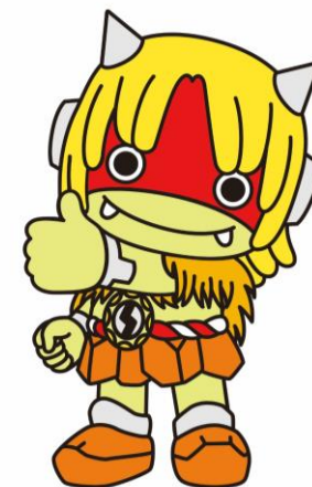
秋田県PRキャラクター 「んだっ子」